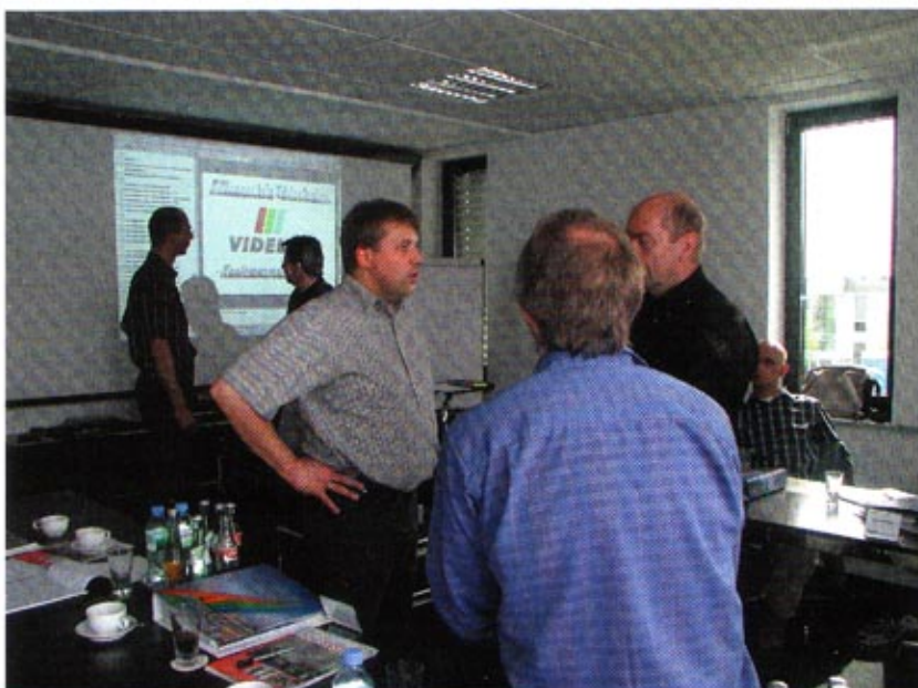
Lebhafte Diskussion während der Schulung